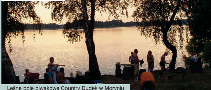
Leśne pole biwakowe Country Dudek w Moryniu

Do atrakcji gminy należą cyklicznie organizowane imprezy sportowe i kulturalne , a ważniejsze z nich to: